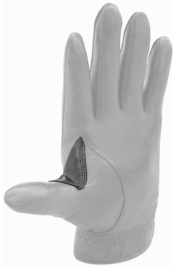
【 사시도 】 도면대용 사시사진

본원 장갑의 엄지부와 검지부 사이 디자인은 엄지부와 검지부 사이에 구비된 닳트 형상에 의하여 시각적으로 미감을 느끼게 하는 것을 디자인창작내용의 요점으로 함.